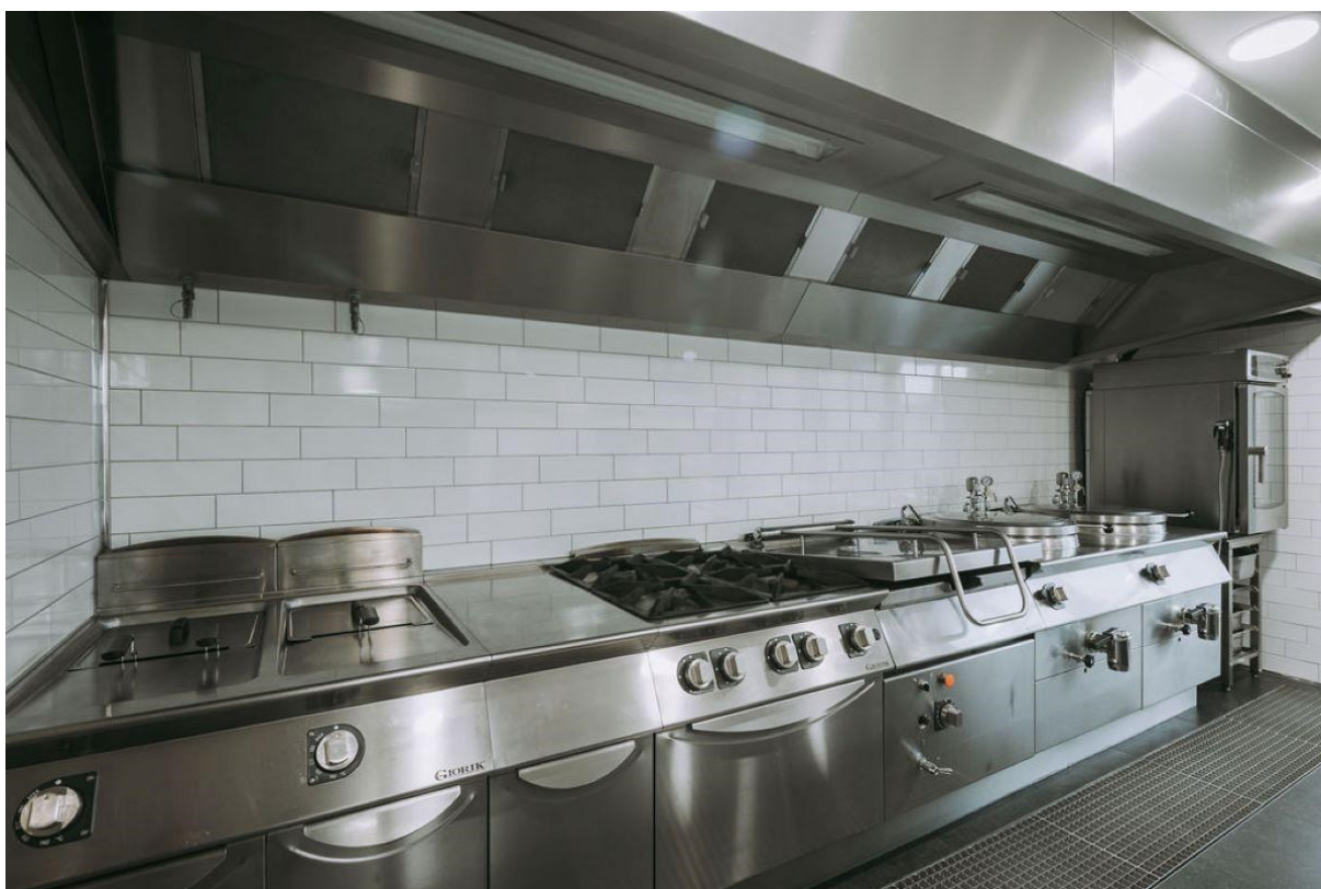
De perfect uitgeruste keuken!