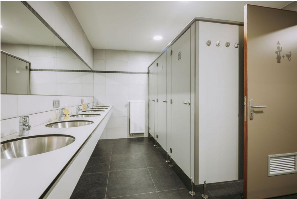
Prima sanitair: nieuwe wc's, douchen en wasbakken