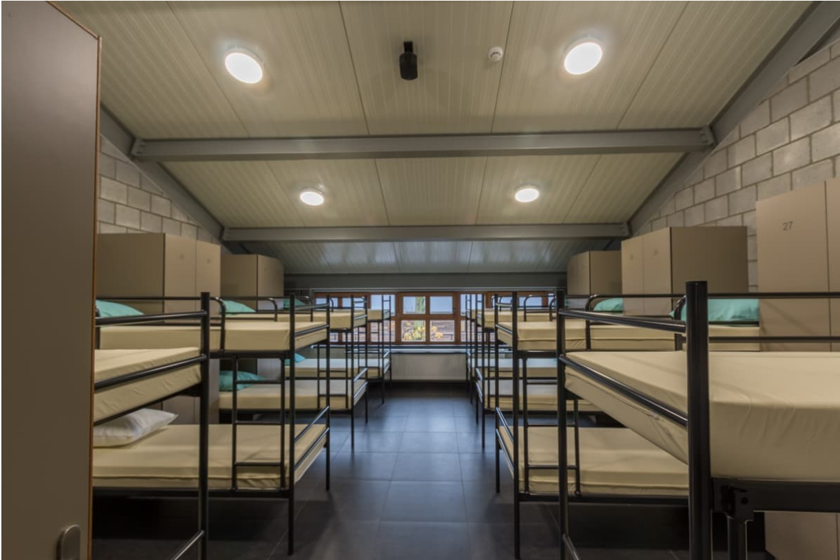
Ruime slaapzalen met voor ieder een kast