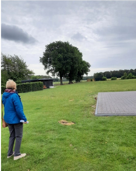
Kamperen doen we aan (onder) de bomen

Er is veel plaats om buiten te kamperen, dus tent, caravan of camper zijn meer dan welkom.